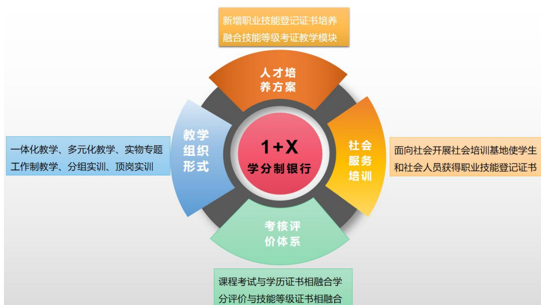
图 4 “1+X”证书制度图