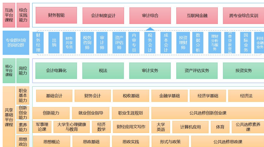
图 3 专业群课程体系框架图